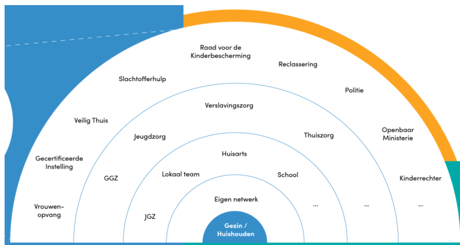
Figuur 4. Betrokken partners bij samenwerken aan veiligheid

In het veiligheidsplan wordt op basis van de eerder gemaakte analyse beschreven wat de zorgen zijn én wat de krachten zijn. Wat is voor de inwoner belangrijk? En wat wil de inwoner? Maar ook: wat ziet de professional als mogelijkheden en kansen om tot verandering te komen? En welke valkuilen ziet de professional? Het plan wordt gezamenlijk met inwoner en betrokken hulpverleners gemaakt en opgeschreven. Het is van belang om samen af te spreken wanneer er een evaluatie plaats vindt en dit ook daadwerkelijk te doen. Voorspelbaarheid kan bijdragen aan vertrouwen. Het feit dat de hulpverlening vrijwillig is, betekent niet dat de professional alleen volgzaam is aan de inwoner. Het vraagt van de professional om haar visie over bijvoorbeeld de voortgang tegenover die van de inwoner te zetten en eerlijk te zijn als er nog zorgen zijn. Het kan ook vragen om directief te zijn richting de inwoner om te sturen dat afspraken die eerder in samenspraak gemaakt zijn zo veel mogelijk bereikt worden. Dit alles in de sfeer van verbinding, omdat iedere vorm van helpen en zorg verlenen relationeel is. 39